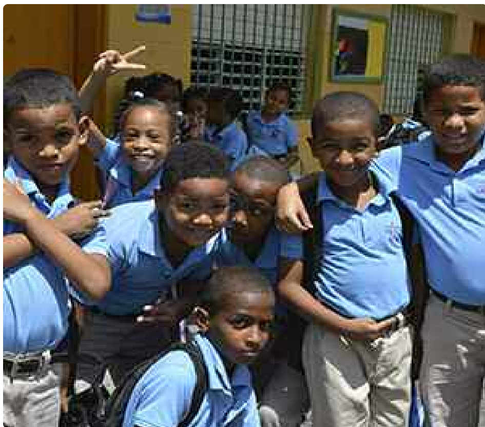
HIGÜEY. Escuela Juan XXIII, dirigida por los Hermanos De La Salle.

Al entregar su alma al Señor, las últimas palabras de San Juan Bautista De la Salle fueron: “Adoro en todo la manera como Dios ha conducido mi vida!” . Muere el 7 de abril de 1719, a los 68 años. Era Viernes Santo.