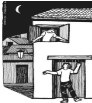
La mejor perspectiva: alzados por nuestros padres.

Cuando Jesús llama a Dios “padre” no pretende definir a Dios como varón. Echa mano del término “padre” para iniciar la oración. Así deja claro, que lo importante de la oración no es qué clase de persona tú