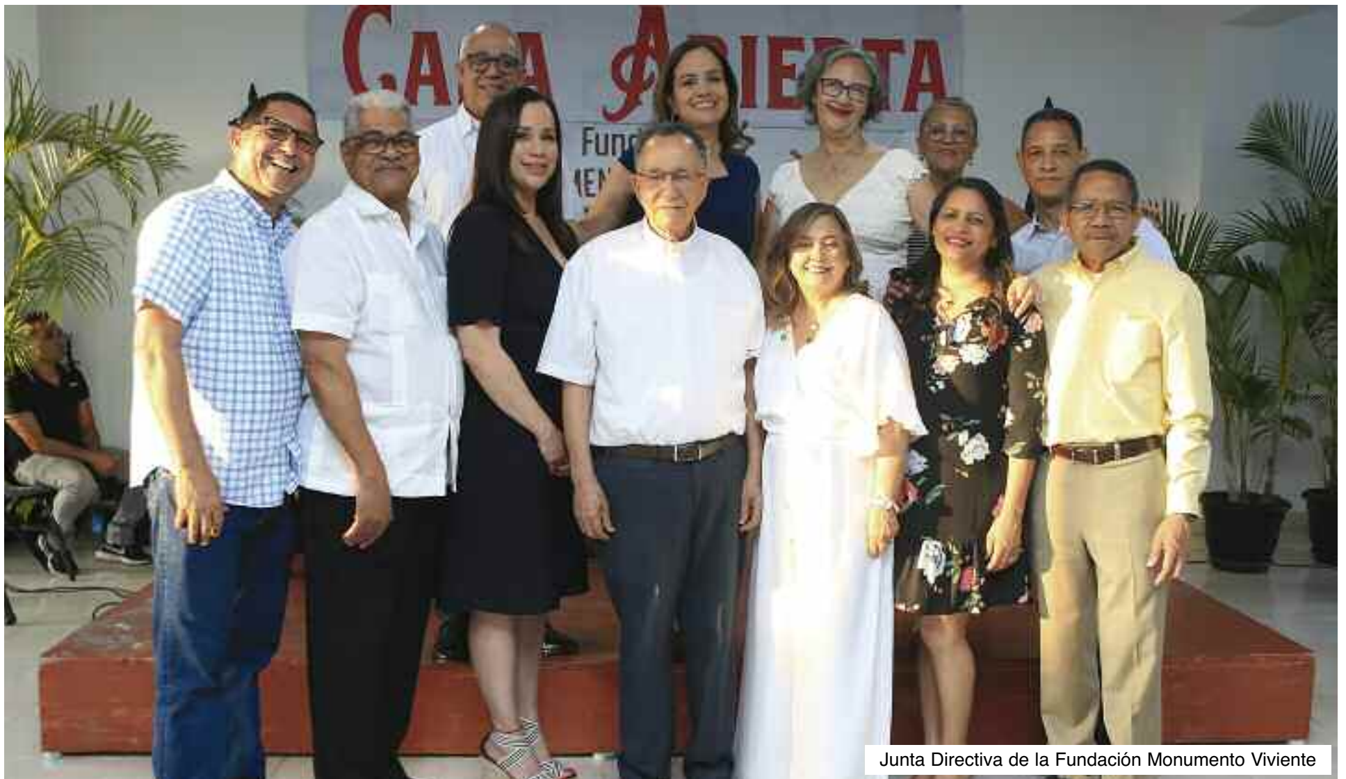
Junta Directiva de la Fundación Monumento Viviente