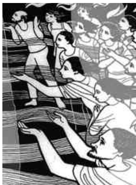
Recibieron un Espíritu de unidad.

La Iglesia está llamada a ser un signo de unidad en medio de los pueblos. Ése es el “poema” que tiene que escribir la Iglesia, como anuncia el Salmo 103, Domingo de Pentecostés. Esa unidad trae sinodalidad, el caminar juntos el camino y permitirá ver qué grande es el Señor.