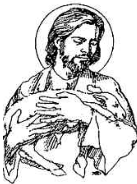
El buen pastor enfrenta al lobo.

Los pastores ya lo saben, ¡faltan las ovejas!