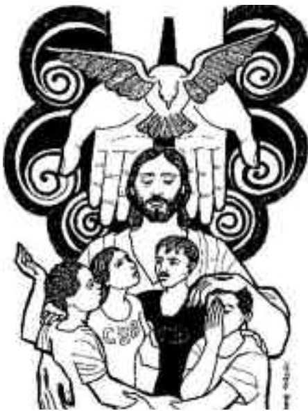
La Trinidad, un solo Dios por Amor.

En el Señor Jesucristo hemos experimentado el favor de Dios, la gracia, que nos abre al amor del Padre y nos vincula en la comunión del Espíritu Santo (2ª Corintios 13, 11 – 13).