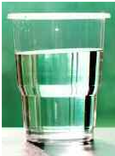
La transparencia se aclara ella mismita

Que todos los funcionarios declaren sus bienes con honestidad serrana y habremos dado un paso hacia la transparencia, base de la justicia y del orden que nos faltan.