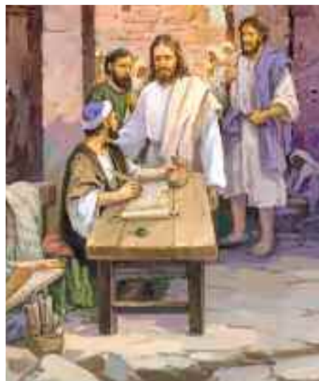
El Señor se agrada en la compasión.

Jesús respondió: “No tienen necesidad de médico los sanos sino los enfermos. Vayan y aprendan lo que significa, ‘misericordia quiero y no sacrificios’; que no he venido a llamar a los justos, sino a los pecadores.”