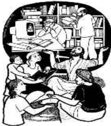
Jesús agradeció el saber de los sencillos.

Jesús nos predica hoy: “aprendan de mí, que soy manso y humilde de corazón, y encontrarán su descanso.” La soberbia fatiga y mata, la mansedumbre descansa y da vida.