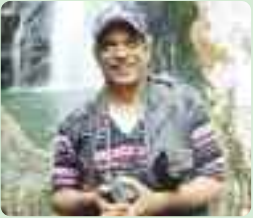
TEXTO Y FOTO: Juan Guzmán