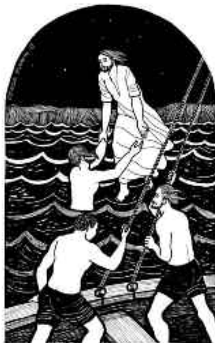
Lo extraordinario es creer.

Nosotros los cristianos, somos los remeros de la barca de Pedro, que Jesús nunca abandonará. A veces, errónea- mente le pedimos al Señor que nos mande a caminar sobre aguas y problemas. Lo que hemos de pedirle al Señor es creer con esa fe que bravea las tormentas junto a los remeros de la barca de Pedro. No hay talleres para aprender a cami- nar sobre las aguas. Pero en la barca de Pedro podemos aprender a creer.