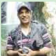
TEXTO Y FOTO: Juan Guzmán