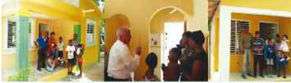
Pastoral Social Caritas de la Diócesis de Barahona, ha bendecido 4 viviendas con financiamiento de Food For The Poor